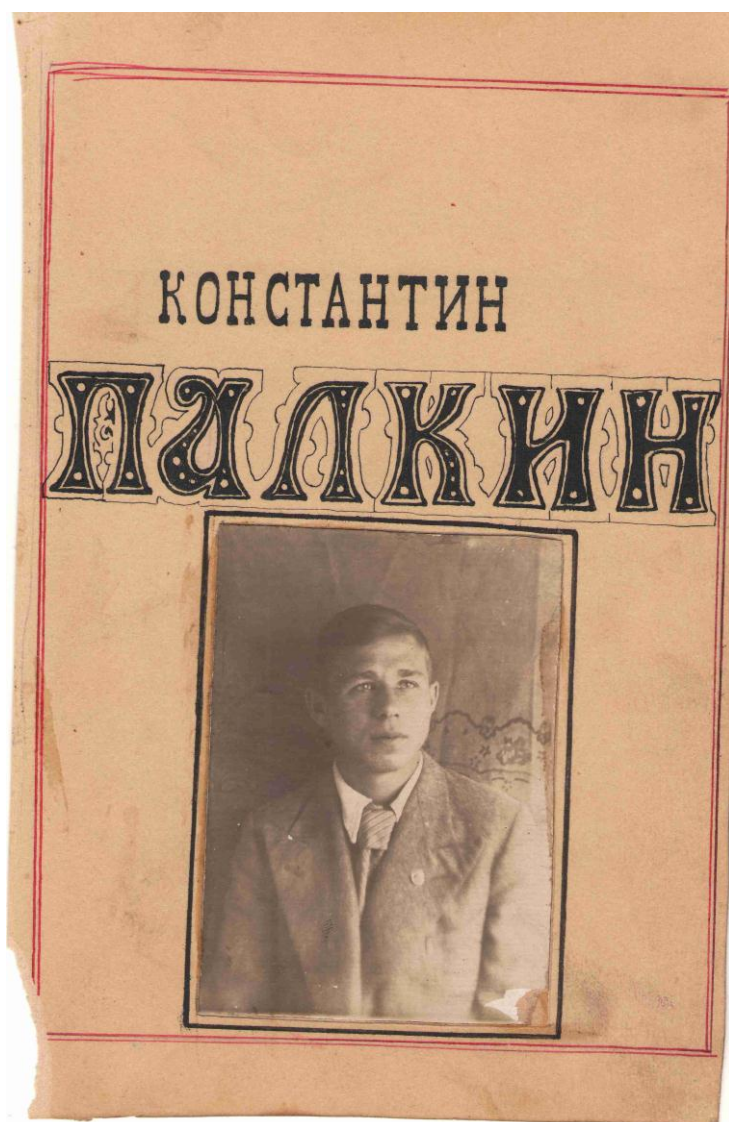
Это титульный лист его блокнота, в котором во время походов на фронт он писал свои стихи. А на груди у него тот самый значок.