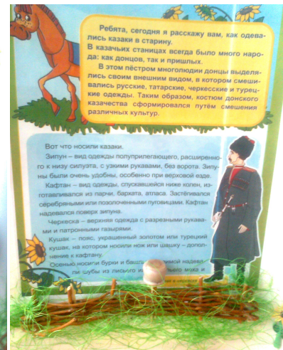
Фотографии сюжетно-ролевой игры: «Казачья изба»